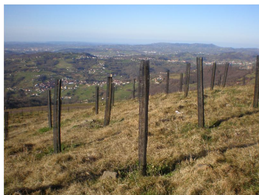
Explotación a cielo abierto La Braña del Río

La ruta comienza en la aldea de La Mudrera, galardonada en 2009, tal y como podemos ver en la placa que hay en la plaza del pueblo, como pueblo más afayaizu del concejo de Langreo. Se trata de una pequeña aldea representativa del caserío tradicional asturiano con casas de corredor, panera, huertos, capilla y una antigua casa del pueblo del SOMA de 1920 hoy rehabilitada como centro social.