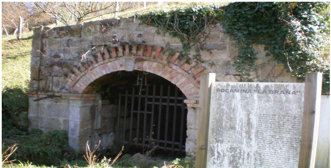
Bocamina de La Braña

Una vez avistadas las primeras casas del “Mayáu Solís”, tomamos un camino que desciende hacia la derecha y giramos en un cruce a la izquierda para continuar descendiendo. Seguimos por el camino principal para llegar a “Baeres d’ Arriba”. Continuamos por la carretera, descendiendo para girar a la derecha a la altura del lavadero y comenzamos a descender por el camino de la derecha, pasando frente un antiguo molino y el desvío a la antigua explotación de montaña “El Repichu”. Seguimos de frente ascendiendo y giramos en un cruce a la derecha. Continuamos y comenzamos a descender girando en un cruce a la izquierda. Continuamos por el camino principal para salir a las primeras casas del pueblo minero de La Braña, junto a la piscina, construida sobre una antigua escombrera.