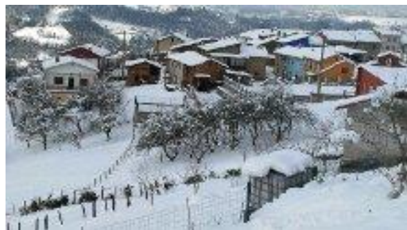
La Mudrera. Langreo.